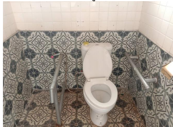
ห้องน้ำสำหรับผู้พิการ