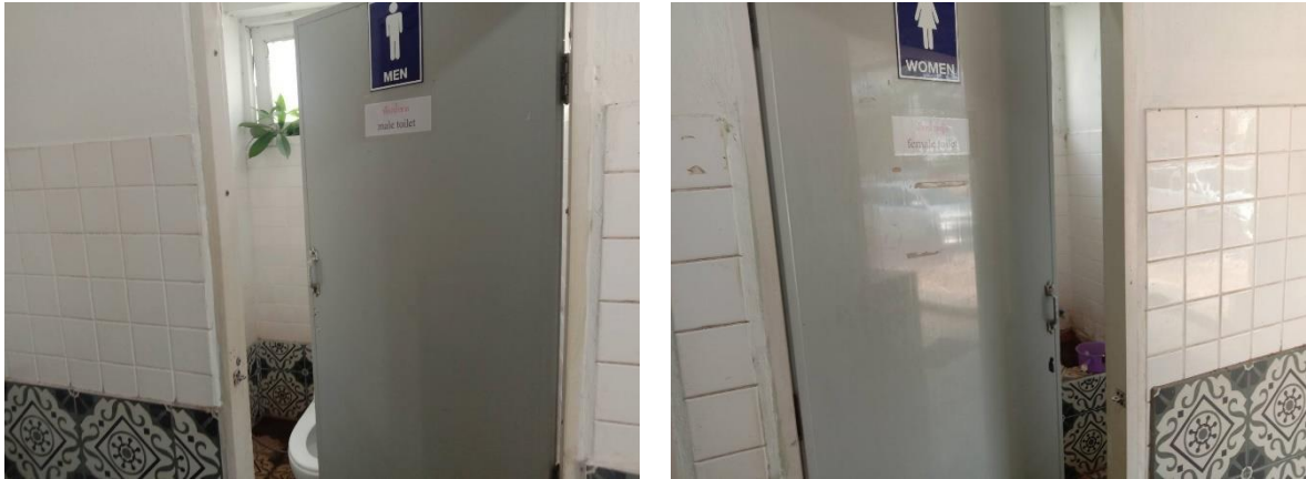
ห้องสุขาสะอาดแยกชายหญิงทั้งสองฝั่งอาคาร

๒) ยกระดับการเผยแพร่ข้อมูลสาธารณะ (OIT) ตามแบบตรวจสอบการเปิดเผยข้อมูล สาธารณะ