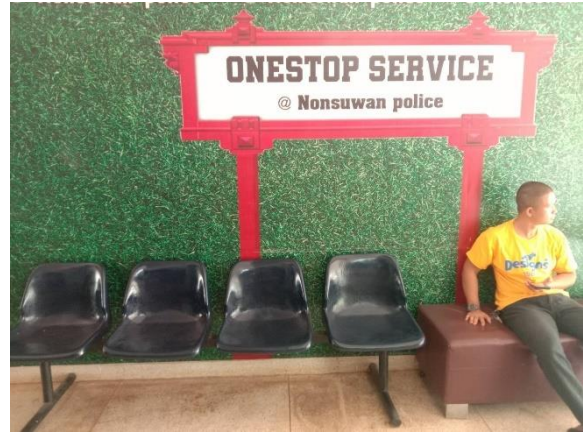
ที่พักรอสำหรับผู้มาใช้บริการ ๒