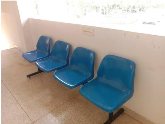
ที่พักรอสำหรับผู้มาใช้บริการ ๑