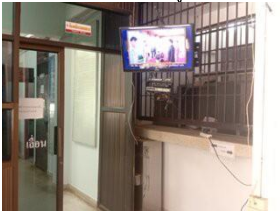
โทรทัศน์สถานีตำรวจแห่งชาติ POLICE TV