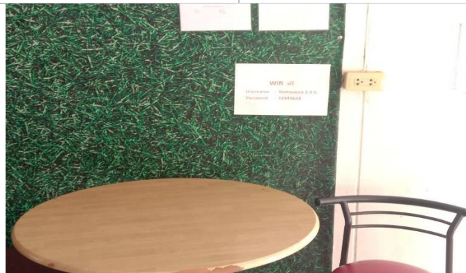
ที่นั่งสำหรับประชาชนและ รหัสเข้าใช้ WIFI ของ สภ.โนนสุวรรณ