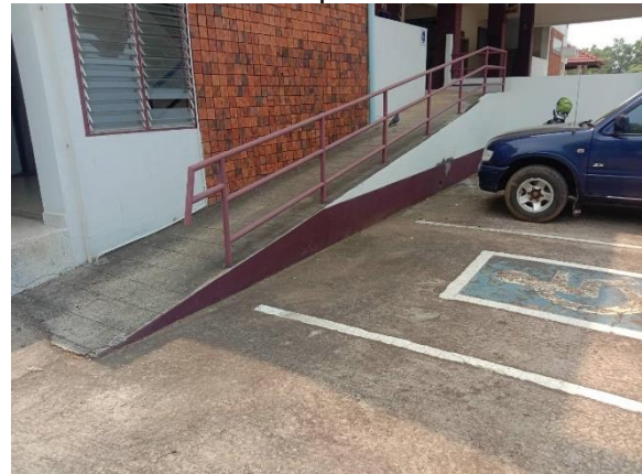
ที่จอดรถผู้พิการ