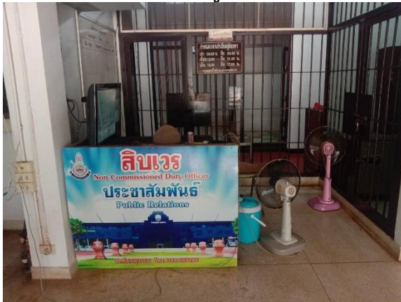
ที่พักรอสำหรับประชาชนผู้มาใช้บริการ ๓