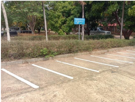
ที่จอดรถสำหรับประชาชนบริเวณด้านหน้า สภ.