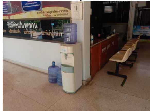
น้ำดื่ม ฟรีไวไฟ